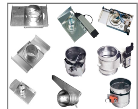
Absperrschieber und Regelklappen, verzinkt