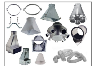
Diverse Hauben, Flex-Schläuche, Montagematerial