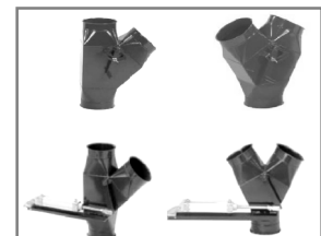
Verteiler geschweißte aus 2mm Stahlblech lackiert