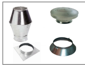
Deflektor- u. Regenhauben