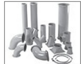
Rollnahtgeschweißtes und Rohrsystem in 2 u. 3 mm Materialstärke, lackiert