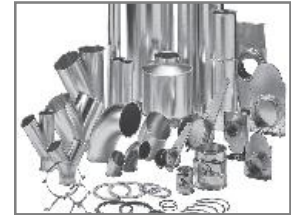
Lasergeschweißtes und Längsgefaltetes Rohrsystem, verzinkt

Undichtigkeiten in einem Rohrsystem verursachen Kapazitätsverlust und unerwünschte Geräusche. Die Rohrsysteme werden ohne wesentliche Toleranzen, hergestellt. Dadurch werden dichte Rohrverbindungen möglich. Die Montage mit Spannringen oder Schnellverschluss-Spannringen ermöglicht die Rohrleitung Dichtklasse „C“ = beste Dichtklasse innerhalb industrieller Absaugung.